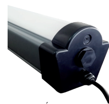
GLÁNDULA CON CABLE