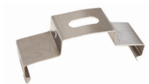
SOPORTE DE MONTAJE ACERO INOX. 316 PARA SOBREPONER INCLUIDO

1. Coloque los soportes de montaje de la luminaria (incluidos) al techo a la distancia requerida.